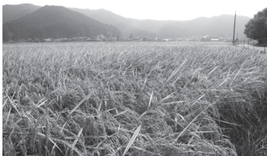
晩夏の田園(赤羽地区)