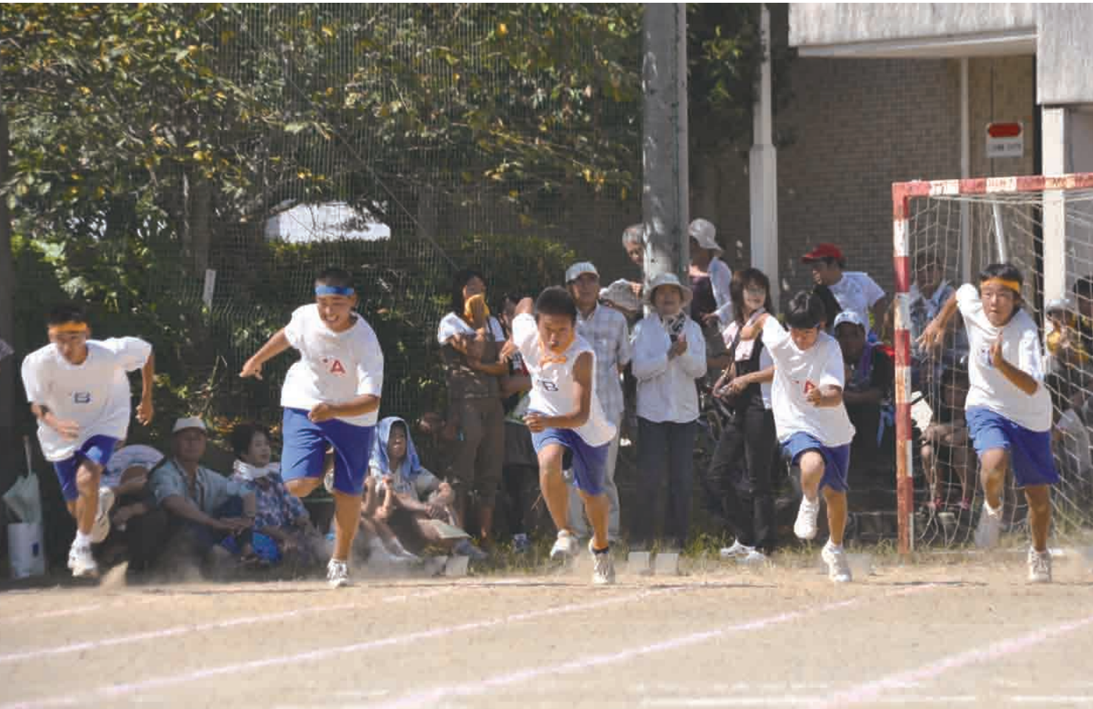
潮南中学校体育祭