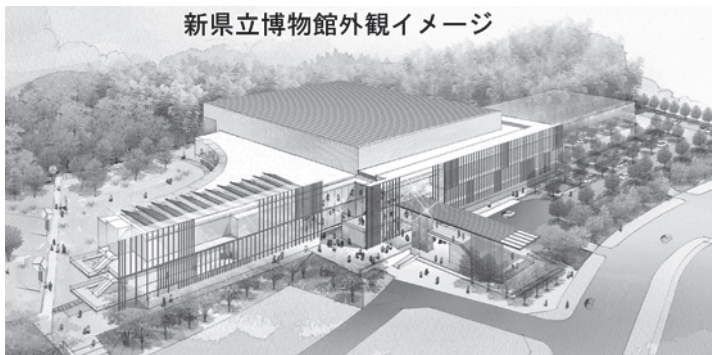
新県立博物館外観イメージ