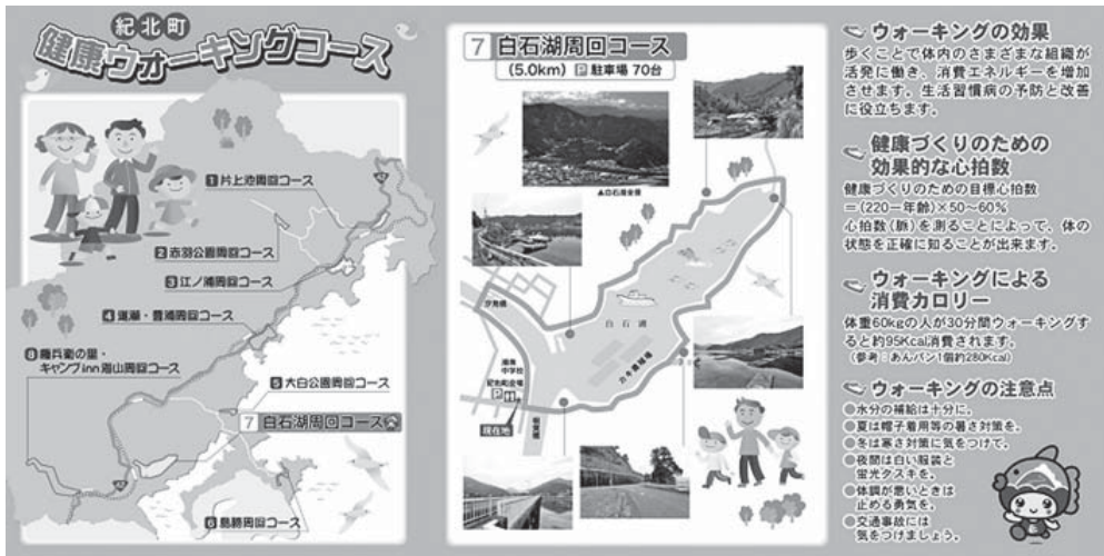
▲設置したの案内板一例です。

現在、町内に8カ所のウォーキングコースを設定しておりますが、今回そのコースごとにウォーキングコースの案内板を設置しました。ウォーキングは健康づくりに最適な方法の1つであり、誰もが簡単にできる運動です。案内板を設置したことのお知らせと健康ウォーキングを推進するために、下記の行事を開催します。ぜひ参加して、健康で長寿の町づくりにご協力ください。