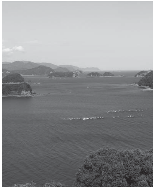
※議会定例会の様子は定例会実施月に、前回の定例会の一般質問の様様をお知らせしますのでご了承ください。